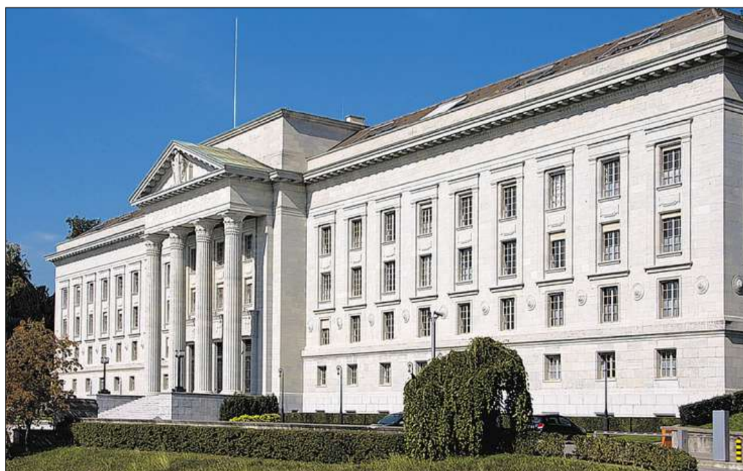
Sedia dal Tribunal federal a Losanna.